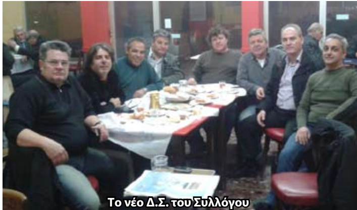
Το νέο Δ.Σ. του Συλλόγου

ΠΩΛΕΙΤΑΙ ΟΙΚΟΠΕΔΟ στη θέση «Σταθάτα» εντός σχεδίου 500 τμ. Τηλέφωνο 697-6848396, Πασχάλη Γιάννη