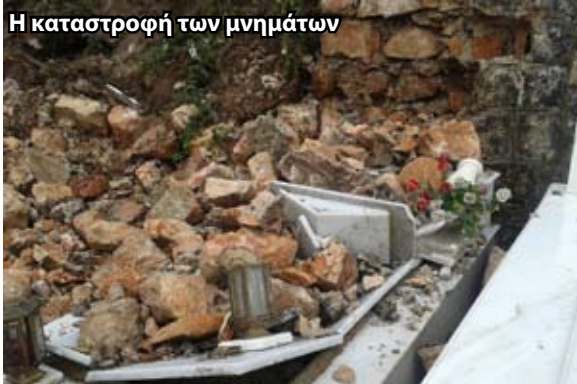
Η καταστροφή των μνημάτων

Οι τεράστιες ποσότητες νερού, είχαν σαν αποτέλεσμα να πέσει το δυτικό τοίχιο στο νεκροταφείο και να καταστραφούν πάνω από 10 τάφοι.