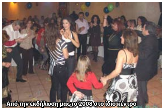
Από την εκδήλωσή μας το 2008 στο ίδιο κέντρο

Στο πολύ γνωστό κέντρο διασκέδασης 'Όνειρο' στην οδό Θράκης 80 στο Καματερό, στο οποίο είχαμε ξανακάνει άλλες δύο φορές την συνεστιάσή μας, θα κάνουμε και εφέτος τον ετήσιο χορό μας. Γνωρίζοντας την οικονομική άσχημη κατάσταση που βιώνουμε όλοι μας, ο σύλλογος μας αποφάσισε να μην έχουμε κανένα κέρδος από την πρόσκληση και έτσι θα είναι 15 € όσο μας την δίνει το κέντρο.