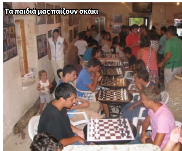
Τα παιδιά μας παίζουν σκάκι

χωρίστηκαν σε κατηγορίες ανάλογα με την ηλικία τους και έκαναν 3 αγώνες ο καθένας. Μετά τους αγώνες απονεμήθηκαν μετάλλια και αναμνηστικά διπλώματα σε όλους. Στο τέλος έφυγαν όλοι ευχαριστημένοι από τους αγώνες και έδωσαν ραντεβού για του χρόνου στο 11 ο Τουρνουά.