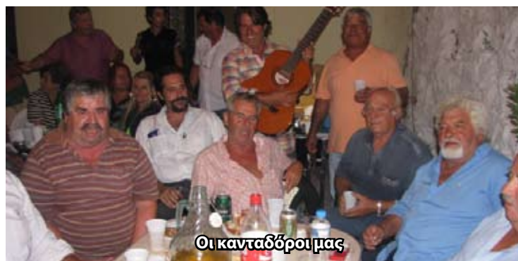
Οι κανταδόροι μας

Σε μία μαγευτική βραδιά που κανείς μας δεν προέβλεψε, εξελίχθηκε η εκδήλωση 'βραδιά Καντάδας' που προγραμματίσαμε στο προαύλιο της Εκκλησίας μας στις 16 Αυγούστου.