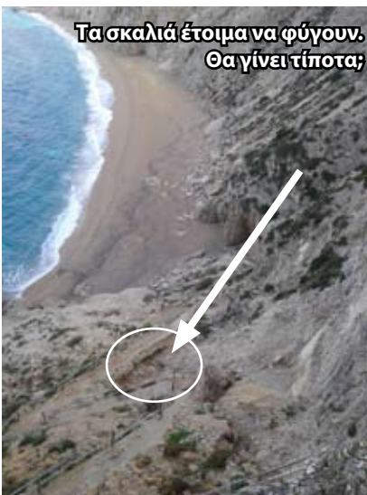
Τα σκαλιά έτοιμα να φύγουν. Θα γίνει τίποτα;

νερού, χύματος και πετρών που πέφτει από την πλατεία, λόγω της μη ασφαλτοστρωσής της.