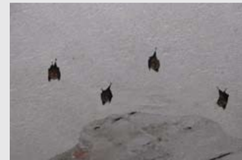
Νυχτερίδες στα κελιά, αντί μοναχών

Το Καμπαναριό μισο-κατεστραμμένο περιμένει την εντολή από τους γραφειοκράτες της Αθήνας για να αποκατασταθεί. Άντε και καλά ξυπνητούρια