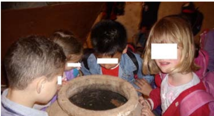
Οι λιλιπούτσιοι μαθητές περιεργάζονται το παλιό πήλινο δοχείο

Μ ε αφορμή την παγκόσμια ημέρα μουσείων τα παιδιά του νηπιαγωγείου Παλικής και οι δασκάλες τους πραγματοποίησαν στο Λαογραφικό Μουσείο Καμιναράτων και πρώην Ελαιοτριβείο επίσκεψη.