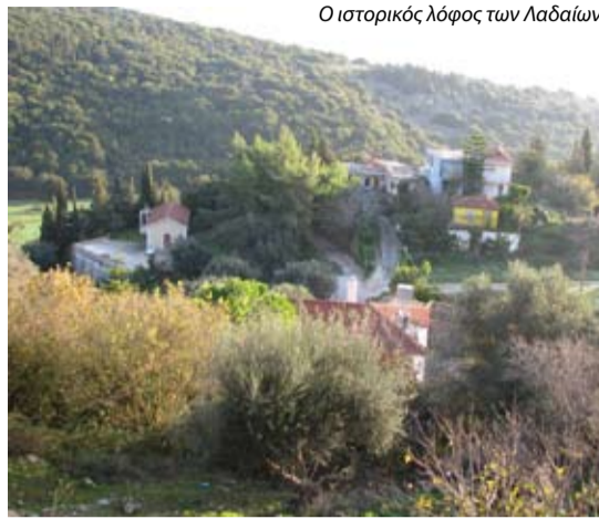
Ο ιστορικός λόφος των Λαδαίων

Άλλη πιθανή θέση επίσης είναι κοντά στον λόγγο ιδιοκτησίας κληρονόμων Θεοφάνη Λαδά στην αρχή της Χούνης (σύνορα Χούνη-Λαγκάδι).