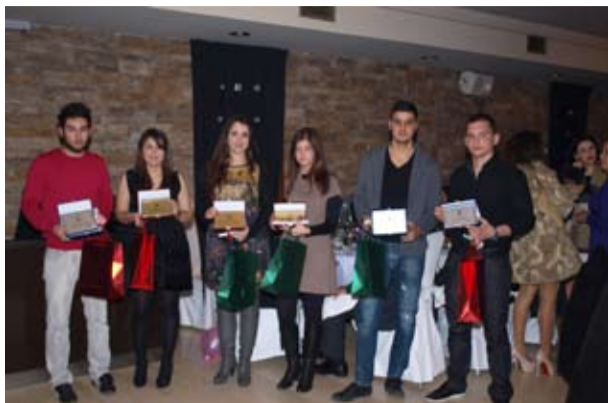
Οι νέοι μας φοιτητές με τις πλακέτες ανά χείρας