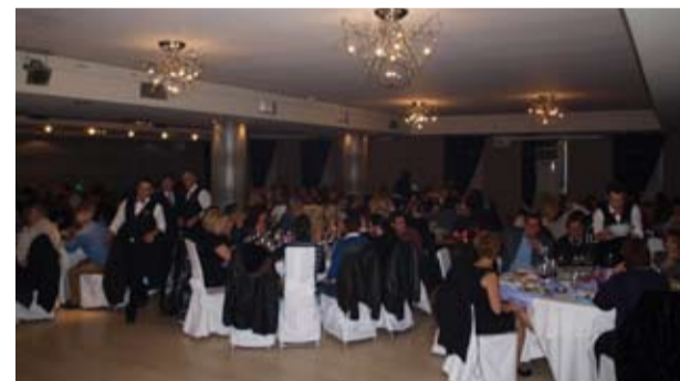
Ασφυκτικά γεμάτη η αίθουσα από χωριανούς και φίλους

Και τέλος γνωρίζοντας πόσο δύσκολα περνάνε σήμερα οι περισσότερες αν όχι όλες οι οικογένειες, με δυο και