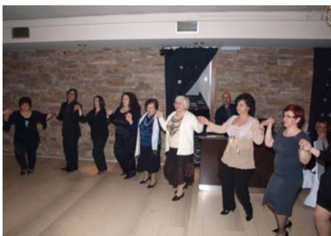
Συγχωριανοί και φίλοι χόρεψαν και διασκέδασαν μέχρι το πρωί