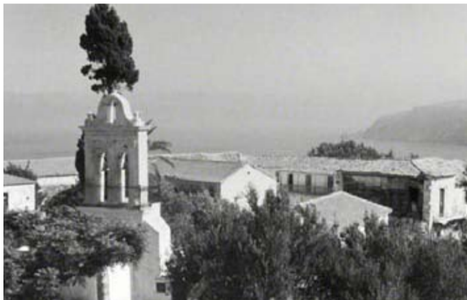
Αποψη του Μοναστηριού ('60)

Το 1889 η Επισκοπική Επιτροπή της Κεφαλληνίας αποστέλλει στην Ιερά Σύνοδο της Εκκλησίας της Ελλάδος έγγραφο με το οποίο προτείνει να εγκριθεί από την Ιερά Σύνοδο η συγχώνευση των δύο Μονών, διότι διαφορετικά κινδυνεύει, όπως λέει, να χαθεί η Μονή του Ταφίου, ενώ η Μονή Κηπουραίων έχει «ικανούς, εργατικούς και φιλόπονους Μοναχούς, ικανούς να επιτηρώσι και την» Μονή του Ταφίου. Παρακαλεί δε την Ιερά Σύνοδο να ενεργήσει προς την Κυβέρνηση ώστε να εκδοθεί σχετικό Βασιλικό Διάταγμα. Προεξάρχων σε αυτή την κίνηση είναι ο Αρχιεπίσκοπος Κεφαλληνίας Γερμανός Καλλιγιάς (1884 - 1889), ο οποίος ενδιαφερόταν ιδιαίτερος για την Μονή και σεβόταν το Δανιήλ. Η βοήθεια του Αρχιεπισκόπου Γερμανού τόσο ως Αρχιεπισκόπου