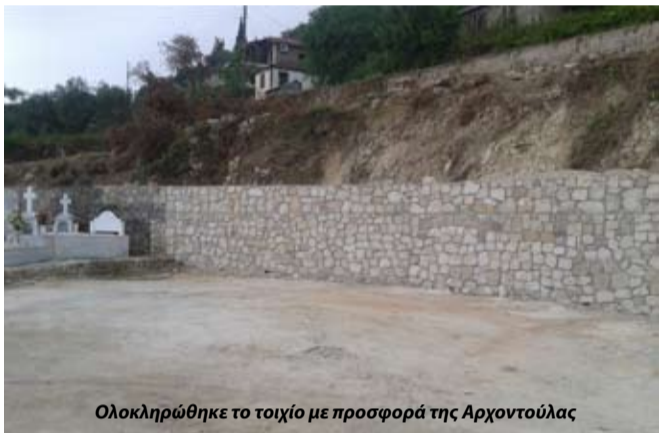
Ολοκληρώθηκε το τοίχιο με προσφορά της Αρχοντούλας

Η κ. Αρχοντούλα Χριστοφοράτου Κωνσταντή και της Μαρίας δείχνοντας την μεγάλη καρδιά και τον σπουδαίο χαρακτήρα της διέθεσε το χρηματικό ποσό των 4000€ τα οποία διέθεσε στον πάρεδρο του χωριού και με αυτά έγιναν τα παρακάτω έργα: